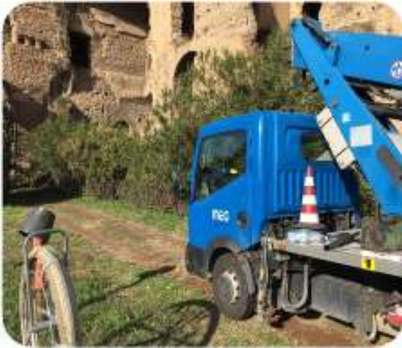
ILLUMINAZIONE ARTISTICA Palatino (Roma)