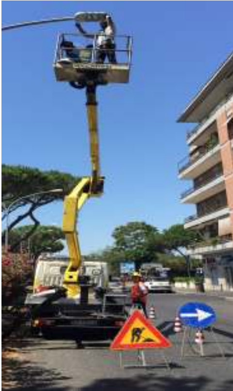
INSTALLAZIONE LAMPADE A LED - ROMA