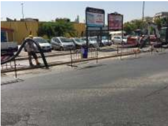
LAVORI DI SCAVO E POSA CAVO VIA COLLATINA-ROMA.