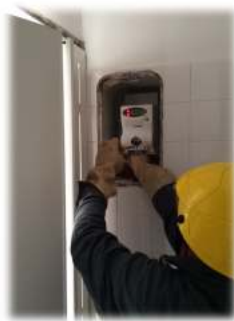
ATTIVITA' DI SOSTITUZIONE CONTATORE ELETTRICO.