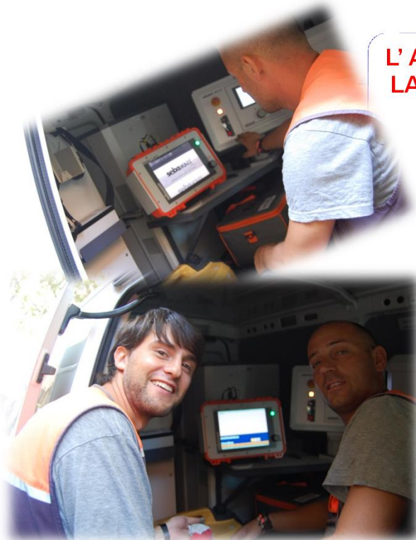
L'ATTIVITA' DEL LABORATORIO MOBILE