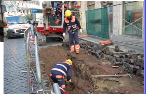
LAVORI DI SCAVO POSA CAVO VIA S.GIOVANNI IN LATERANO