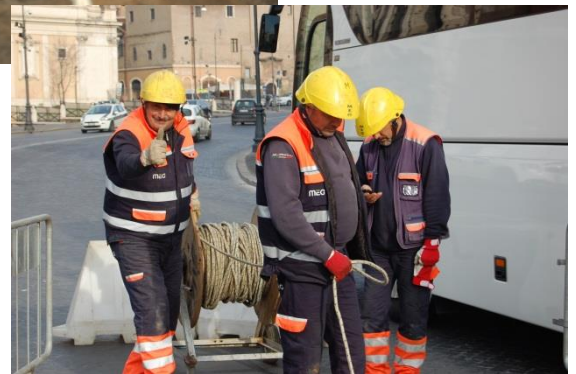
LAVORI IN GALLERIA A VIA TEATRO MARCELLO