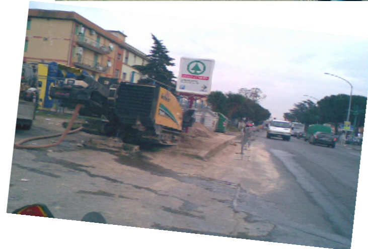
Lavori di posa cavo in perforazione di via casilina